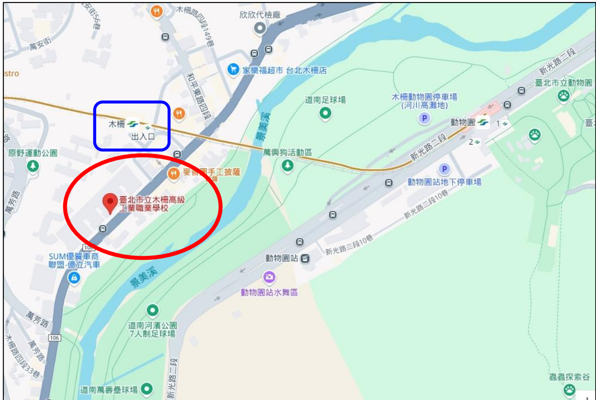
▲該校地點周邊道路圖