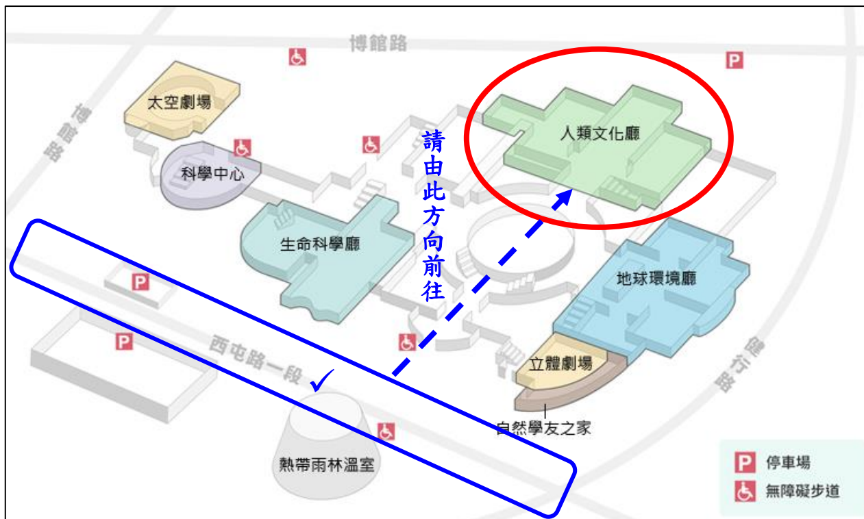
▲該展廳位置周邊道路圖