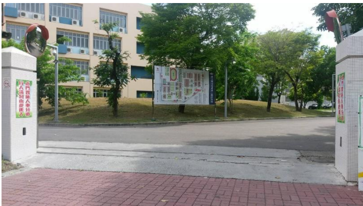
▲鳳山商工側門(停車由此進入)