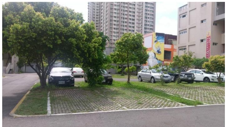
▲校區內停車位場景